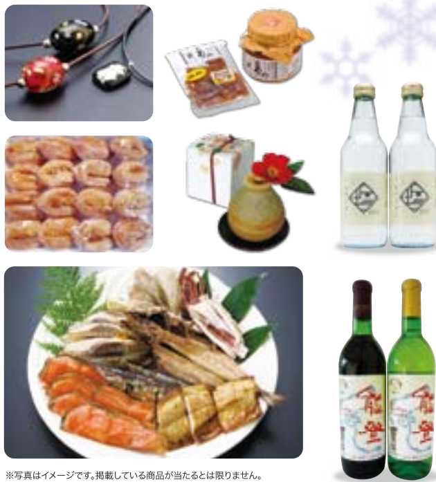
※写真はイメージです。掲載している商品が当たるとは限りません。